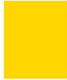
PMS Pantone Yellow