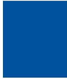
PMS Reflex Blue